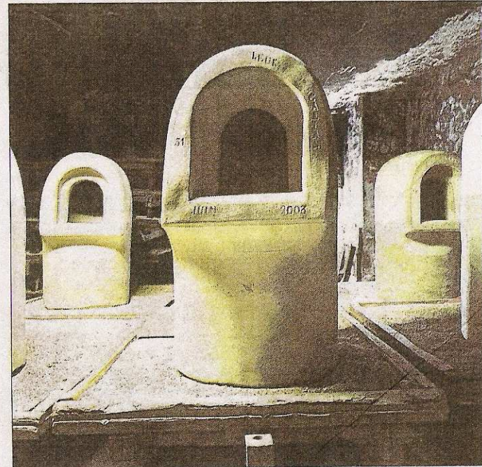
■ Anciens fours des cristalleries de Saint-Louis, par Adeline Bommart.

« Texas Lorrain », la photographe a arpenté les sites « à la lumière du matin ou du soir », montrant ainsi par exemple les couleurs improbables d'un atelier de souffleur dans la Cristallerie de Saint-Louis. Elle a posé son appareil argentique 6x6 et son regard « cadre » pour sublimer ce que nous habitants de ces paysages plombés de Lorraine n'avions